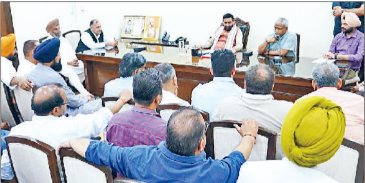
हरिभूमि ब्यूरो चंडीगढ़

नायब ने कहा, भाजपा ही पंजाब में ऐसी सरकार दे सकती है, जो सबका मला करे