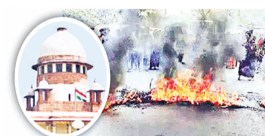
आगजनी करके रास्ता बंद किया गया

9 घंटे तक बंधक बनाकर रखा, खाना-पानी तक नहीं मिला