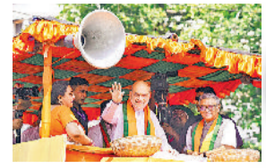
भवानीपुर

पश्चिम बंगाल चुनाव को लेकर केंद्रीय मंत्री अमित शाह ने भाजपा की कमान संभाल ली है। गुरुवार को वे सुबह 10 बजे अधिकारियों के नामांकन में शामिल होने के लिए भवानीपुर पहुंचे और मुख्यमंत्री ममता बनर्जी पर जमकर निशाना साधा। कार्यकर्ताओं को संबोधित करते हुए उन्होंने कहा कि मैं बंगाल आया हूँ और 15 दिन तक यहीं रहूँगा। मैं अधिकारियों के नामांकन के लिए आया हूँ। अधिकारियों को जीत बंगाल में परिवर्तन की नींव रखने वाली है। शाह ने कहा कि पिछली बार ममता नंदीग्राम में हार गई थीं और इस बार भवानीपुर के साथ पूरे बंगाल में उन्हें हार का सामना करना पड़ेगा। पूरा बंगाल ममता की विदाई करने के लिए तैयार है। सुबह 11 बजे शाह ने लड़ना चाहते थे, मैंने कहा था ममता के घर में जाकर उन्हें हराना है। उन्होंने जोर देकर कहा कि अधिकारियों का नामांकन बंगाल में टीएमसी के पतन की शुरुआत साबित होगा। शाह ने दावा किया कि पूरे बंगाल का दौरा किया है और हर जगह से एक ही आवाज सुनाई देती है। ममता को बाय-बाय कहने का समय आ गया है।