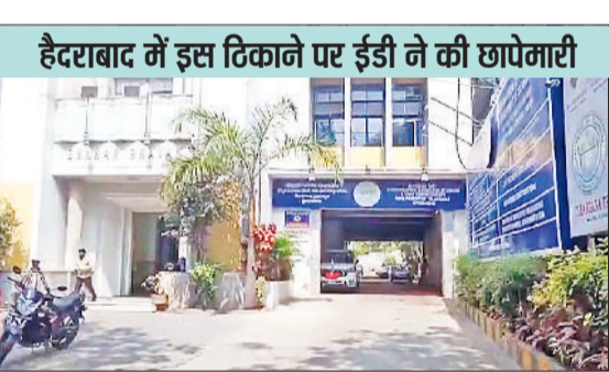
हैदराबाद में इस ठिकाने पर ईडी ने की छापेमारी

की पार्टी टीएमसी के लिए चुनाव मैनेजमेंट का काम देखती है। आई-पैक और उसके डायरेक्टर पर करोड़ों रुपये के कोयला चोरी घोटाले से जुड़े मनी लॉन्ड्रिंग का आरोप है। इस मामले में सीबीआई ने 27 नवंबर 2020 को एफआई