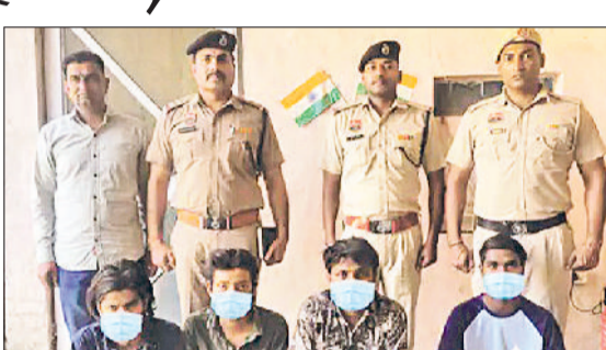
फरीदाबाद। पुलिस की गिरफ्तार में हत्या के आरोपी।

गर्लफ्रेंड से मिलने आए युवक की उसकी छोटी बहन से हुई कहासुनी ने खूनी रंग ले लिया। युवती की बहन ने विवाद के बाद फोन कर अपने दोस्तों को बुला लिया और उन्होंने चाकूओं से गोदकर युवक की हत्या कर दी। वारदात देखकर आसपास के लोगों ने पुलिस को सूचना दी। सूचना पर पहुंची पुलिस ने घायल युवक को उठाकर अस्पताल पहुंचाया, जहां डॉक्टरों ने उसे मृत घोषित कर दिया। पुलिस ने शव को कब्जे में लेकर पोस्टमॉर्टम के लिए भेज दिया। उधर, पुलिस ने इस मामले में पांच आरोपियों को गिरफ्तार कर लिया है, जिनसे पूछताछ की जा रही है।