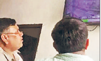
पुलिस टीम कैमरों की जांच करते हुए।