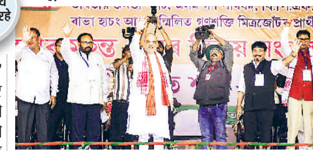
भवानीपुर में रेली को संबोधित करते केंद्रीय गृहमंत्री शाह